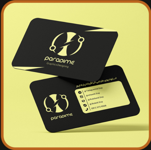
نمونه کارت ویزیت