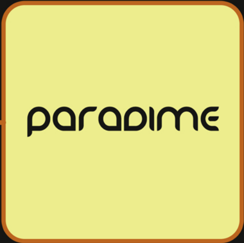
نمونہ لوگوئی نوشتارى