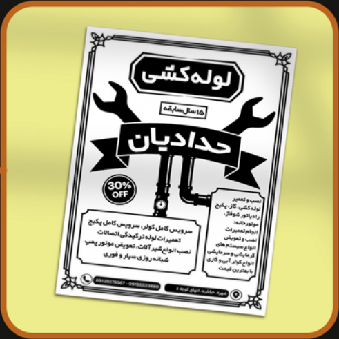
نمونه تراکت رنگی