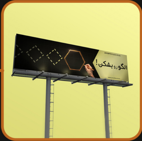
نمونه بنر و بیلبورد