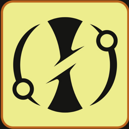
نمونہ لوگوئی تصویرى