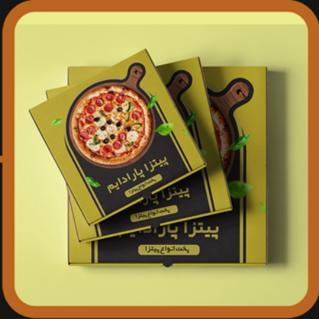
نمونه جعبه پیتزا